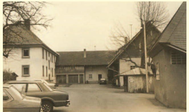
Anfang der 1980er Jahre

In loser Folge erscheint in dieser Rubrik Wissenswertes und historisch Interessantes aus unserer Gemeinde.