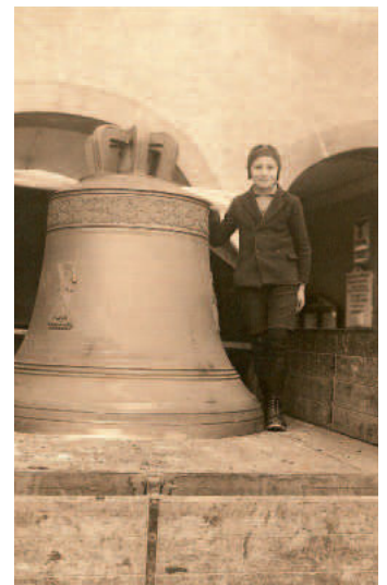
Kriegsbedingte Abholung 1941

Schon am 4. Januar 1909 holen acht Fuhrwerke mit 38 Pferden die in der Gießerei Grüninger in Villingen gegossenen sechs neuen Glocken am Bahnhof in Hinterzarten ab. Unter Beteiligung der Musikkapelle und einem Großteil der Bevölkerung werden sie zur Weihe in den Chor der Kirche gehängt. Nur 32 Jahre später ist auch ihr Schicksal besiegelt. Für Kriegszwecke werden im Dezember 1941 alle sechs Glocken aus den Türmen geholt. Um auf den Stundenschlag nicht verzichten zu müssen, hängt man als Ersatz eine Eisenschiene in den Turm.