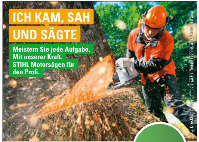
für Druckfehler übernimmt die ZG Raiffeisen Technik GmbH keine Haftung

Meistern Sie jede Aufgabe. Mit unserer Kraft. STIHL Motorsägen für den Profi.