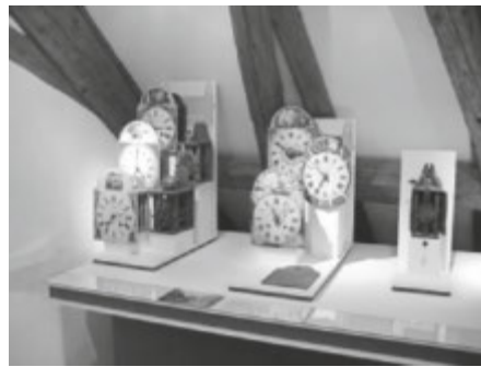
Schwarzwälder Uhren im Kloster Museum St. Märgen

Alle Informationen zum Naturpark finden sich unter www.naturpark-suedschwarzwald.de .