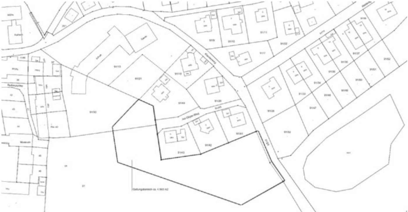
Gemeinde St. Märgen – Lageplan vom 22.10.2024 (unmaßstäblich)

Der Geltungsbereich ergibt sich aus folgendem Lageplan vom 22.10.2024 (ohne Maßstab):